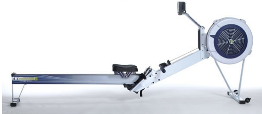
Der Concept 2 Ruderergometer Model D